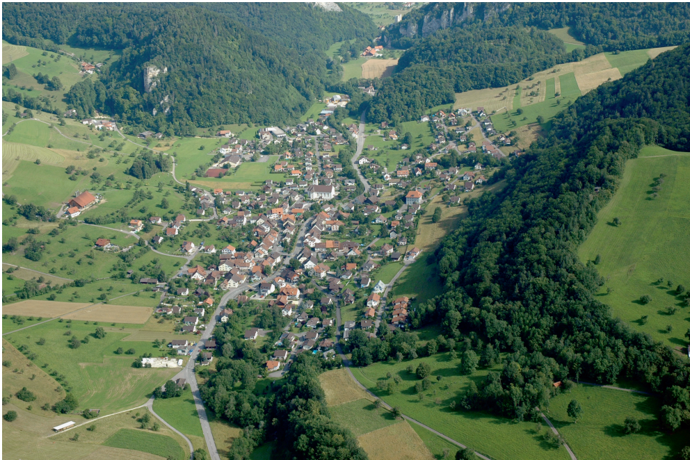
Abb. 1. Erschwil aus der Vogelperspektive. Aufnahme 2007, P. Brotschi. – Erschwil from a bird's-eye view in 2007.

offenen Landschaften auf lokaler Ebene, beispielsweise in einer Gemeinde, auf die Vogelwelt auswirken, sind jedoch selten. Als offene Landschaften bezeichnen wir dabei sowohl das Landwirtschafts- als auch das Siedlungsgebiet.