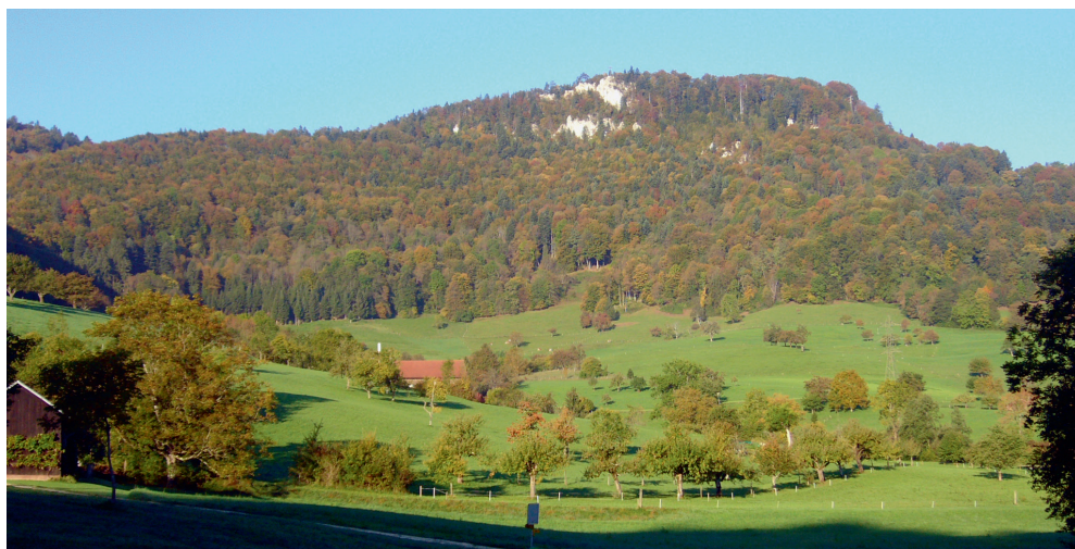
Abb. 5. Landschaft in Erschwil mit Laubmischwald, Felskuppe und Obstgarten. Aufnahme 7. Oktober 2010, J. Borer. – Landscape in Erschwil with rocks, deciduous forest and orchard.

kaler Natur ist der Bestandsrückgang des Stars und der Goldammer in Erschwil. Während beim Star die Rückgangsursachen unklar sind, hat die Goldammer wohl deshalb abgenommen, weil einzelne Flächen durch eine veränderte Nutzung, insbesondere das Entfernen von niedrigen Gebüsch und Brombeerstauden, für sie heute weniger geeignet sind als früher (pers. Beob.). Beim Feldsperling ist es fraglich, ob die festgestellten Bestandseinbussen in Erschwil tatsächlich einem Bestandsrückgang entsprechen, da nicht klar ist, ob die beobachtete Abnahme in Erschwil von 18 auf 13 Revie-re einer tatsächlichen Abnahme entspricht oder ob auch kurzfristige und vollkommen natürliche Populationsschwankungen die Ursache dafür sind. Unklar sind die Ursachen für die unterschiedlichen Bestandsentwicklungen beim Eichelhäher: Über die gesamte Schweiz gesehen nimmt sein Bestand zu. Regional gibt es jedoch durchaus gegenläufige Entwicklungen; beispielsweise ist der Bestand im Kulturland des Kantons Zürich zwischen 1986–88 und 1999 stark zurückgegangen. Eine vergleichbare Entwicklung zeigt sich im Erschwiler Offenland. Die Tannenmeise ist wahrscheinlich vor allem wegen des Rückgangs von Nadelhölzern im Schweizer Wald (Brändli 2010) landesweit