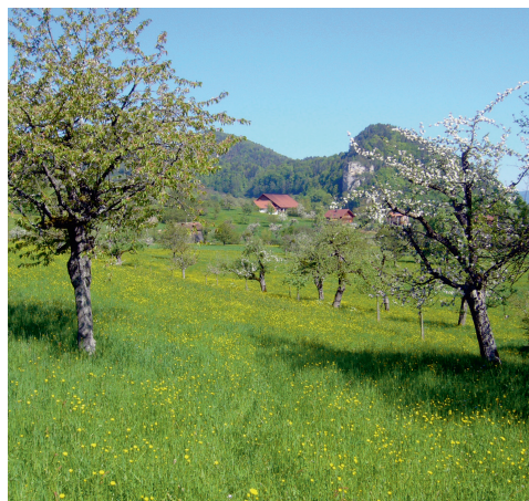
Abb. 2. Obstgarten Geren, Erschwil. Aufnahme 6. Mai 2008, J. Borer. – Orchard in Erschwil.

Bei der Revierausscheidung hielten wir uns eng an die MHB-Methode (Schmid et al. 2004). Grundsätzlich wurde ein Revier nur dann ausgeschieden, wenn es sich bei der Beobachtung um einen potenziellen Brutvogel in einem Habitat mit vorhandenen Nestmöglichkeiten handelte. Zusätzlich wurden jeweils die artspezifischen Kriterien gemäss Schmid & Spiess (2008) berücksichtigt. Dabei handelt es sich einerseits um spätere Stichdaten bei Zugvögeln und andererseits um erhöhte Ansprüche betreffend des Atlascodes bei Arten, die auch während der Brutzeit noch umherstreifen. In einem ersten Schritt führten die Kartierenden selbst die Revierausscheidungen für die von ihnen bearbeiteten Flächen durch. Diese Einteilungen wurden danach besonders entlang der Grenzen einzelner Kartierungsflächen vollständig überprüft und vereinheitlicht.