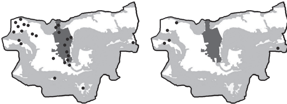
Abb. 4. Revierkarte der Gartengrasmücke für das Jahr 1994 (links) und 2010 (rechts). Punkte = Gartengrasmücken-Reviere; weiss = Kulturland; dunkelgrau = Siedlungsgebiet; hellgrau = Wald. – Map with territories of the Garden Warbler for 1994 (left) and 2010 (right). Dots = Garden Warbler territories; white = farmland; dark grey = settlements; light grey = woodland.

besiedeln. Verstärkt wird dieser Vorgang möglicherweise, wenn gleichzeitig der Konkurrenzdruck im Kulturland durch das Seltenwerden der dort eigentlich typischen Vogelarten sinkt. Da es sich bei den Arten mit Bestandsveränderungen nicht speziell um Wärme oder Kälte liebende Arten handelt, sind die beobachteten Veränderungen wohl nicht auf den Klimawandel zurückzuführen.