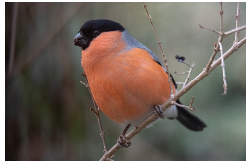
Foto oben: Schwanzmeise (Bärschwil, Jan. 2022) Foto unten: Gimpel, Männchen (Bärschwil, März 2022)